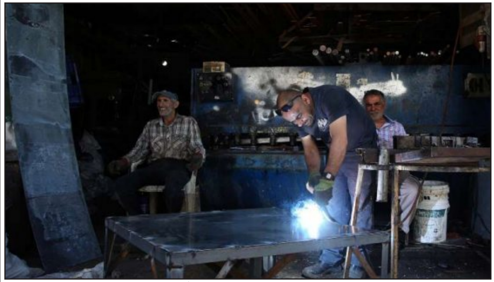
عمال فلسطينيون يواصلون أعمالهم في مهنتهم الحرفية تزامناً مع يوم العمال

ووفقاً لآخر استطلاع للرأي أجراه مركز الدراسات الاستراتيجية في الجامعة الأردنية العام الماضي وشمل 2400 شخص، أكد 52% ممن تم استجوابهم أن حظر التجول ساهم في زيادة نسبة تدخينهم للسجائر والنرجيلة.