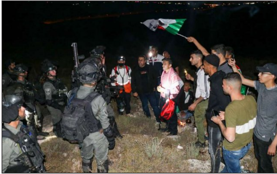
جنود الاحتلال يمنعون أهالي بلدة نعلين والقرى المجاورة من إغلاق الطرق التي شقها المستوطنون في أراضيهم فجر الأمس

محافظات/ الاستقلال: ما زالت قوات الاحتلال «الإسرائيلي» تصعد من عدوانها في مدينة القدس المحتلة، ومناطق الضفة الغربية، ما أسفر عن إصابة