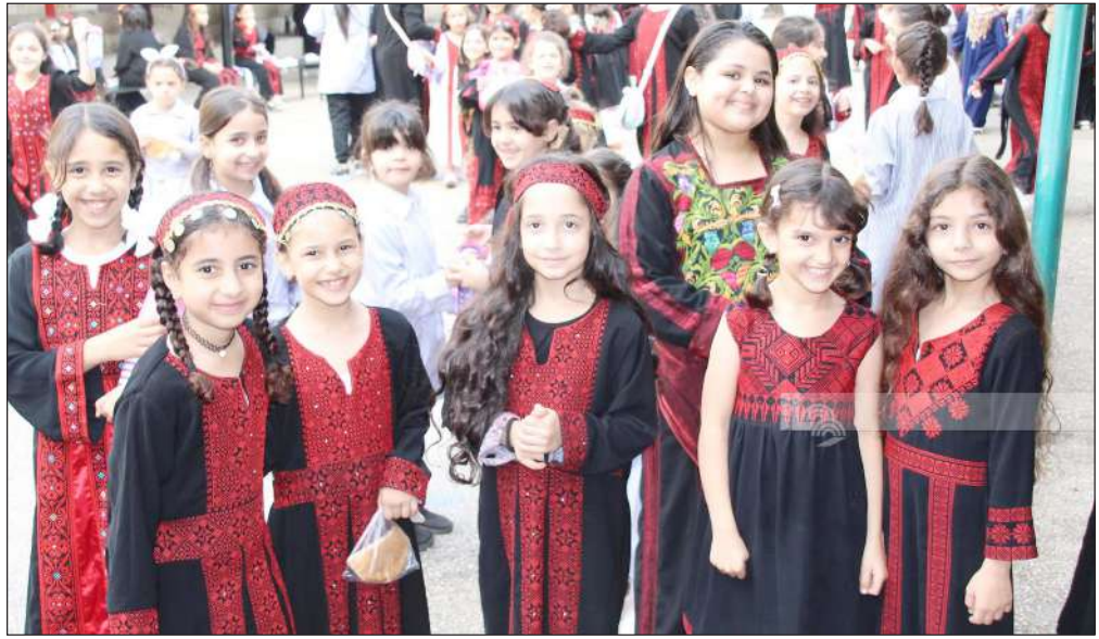
إحياء يوم التراث الفلسطيني في مدارس طولكرم

وأكد أحد أقارب العائلة أن الكلبين اللذين تسببا بقتل الصغيرين، من الحيوانات الأليفة التي ترعاها العائلة منذ 8 سنوات، ولم يحدث أن أقدمت على أي سلوك عدواني.