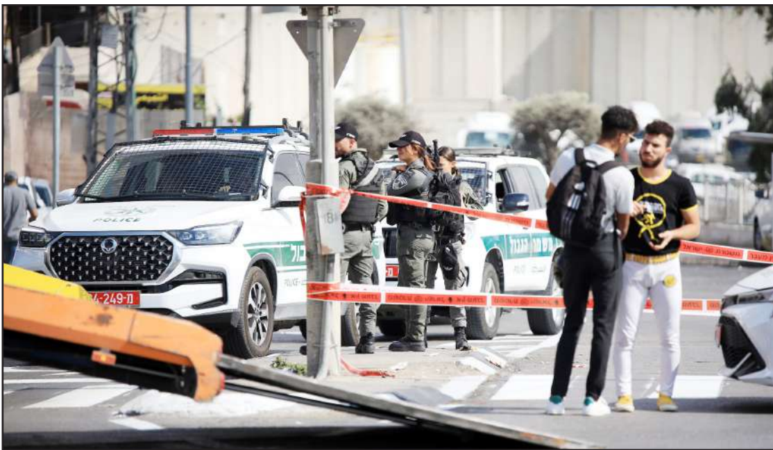
انتشار قوات الاحتلال في مكان عملية شعفاط بالقدس المحتلة أمس