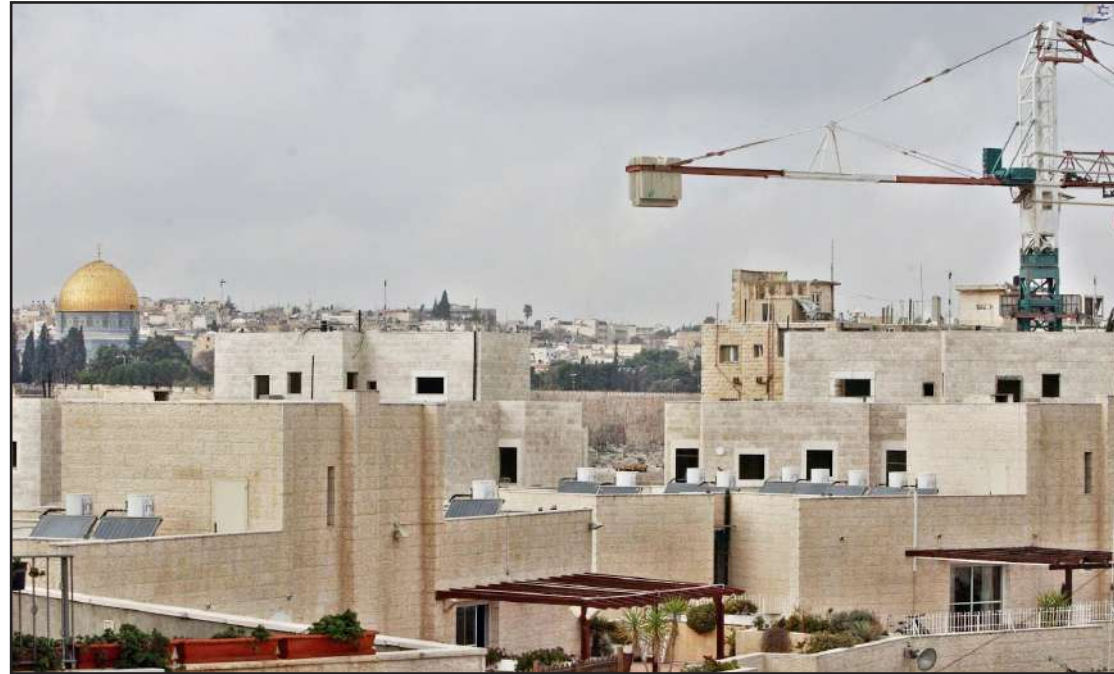
الاحتلال يواصل بناء المستوطنات في مدينة القدس المحتلة

القدس المحتلة- الضفة الغربية/ الاستقلال: أعدت قوات الاحتلال الاسرائيلي خطة لبناء آلاف الوحدات الاستيطانية على أراضي مطار القدس الدولي "قلنديا" شمال مدينة القدس