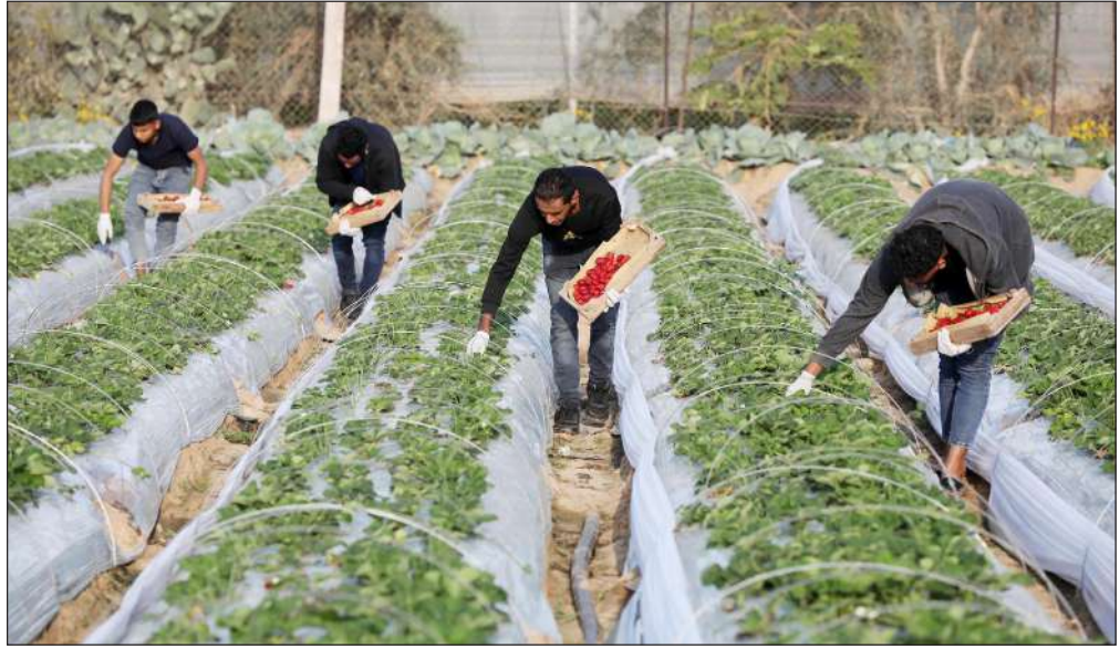
انطلاق موسم قطف الفراولة في بيت لاهيا شمال قطاع غزة

وفقا للكونفدرالية، أقدم متبرع في إيطاليا هي امرأة توفيت في نهاية أكتوبر في مدينة فابريانو عن عمر يناهز 97 عاما و 7 أشهر.