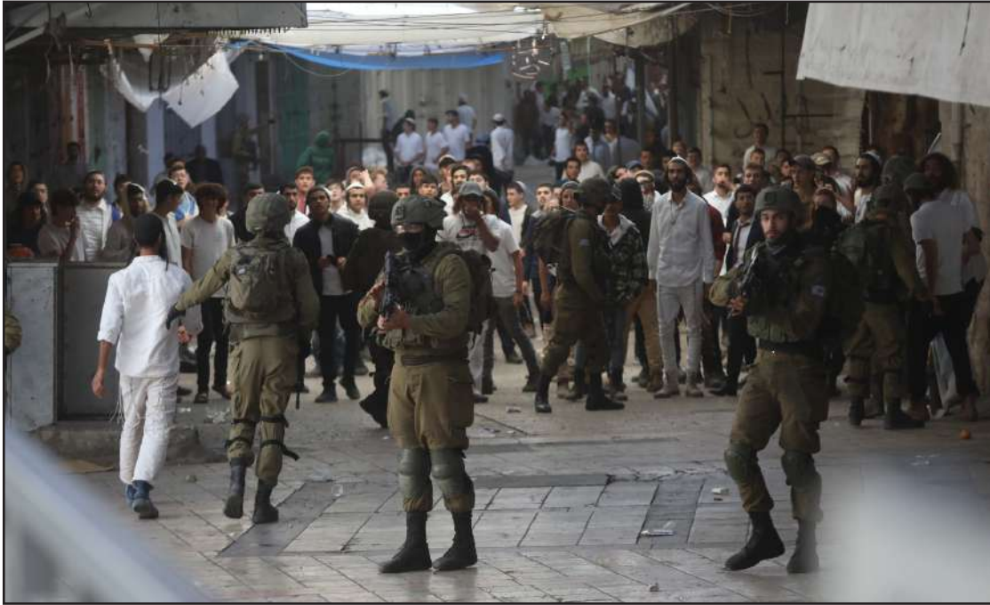
قوات الاحتلال تعدي على المواطنين في شارع الشلالة وسط الخليل، لتأمين اقتحامات المستوطنين

الضفة المحتلة/الاستقلال: أصيب العديد من المواطنين أمس بجراح مختلفة إثر مواجهات مع قوات الاحتلال