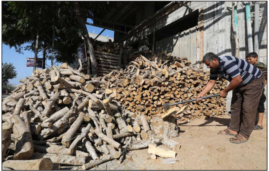
حطاب فلسطيني يقطع الأخشاب جنوب قطاع غزة، ويجهزها للبيع خلال فصل الشتاء

وتناول فيلم فرنسي بعنوان «غوغو» جهود بريسيلا هذه، مما أتاح لها السنة الفائتة أن تستقل للمرة الأولى في حياتها طائرة وتتوجه إلى فرنسا لمقابلة عقيلة الرئيس الفرنسي بريجيت ماكرون.