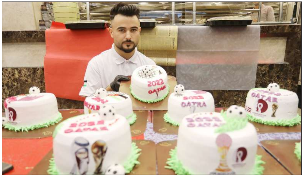
مواطن يعرض كيكة مزينة بأشكال مرتبطة بكأس العالم بقطر في مدينة خانيونس

وفي حين تم إدخال تشريع لتسهيل عملية إعطاء الأطفال للتبني، فإنه لا تزال هناك عراقيل أمام الآباء الجدد.