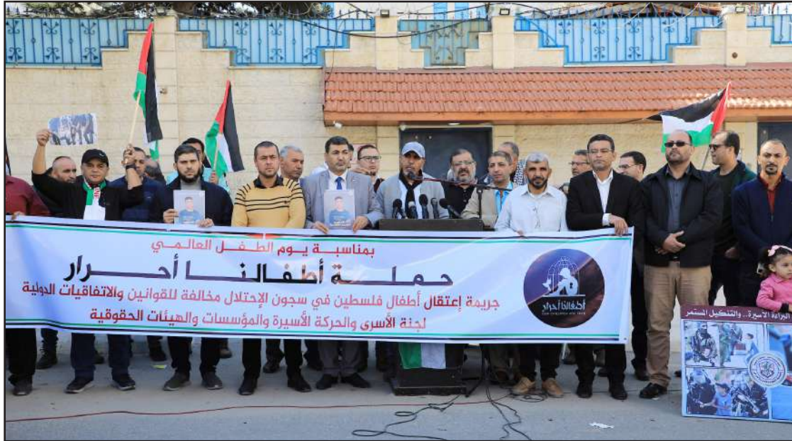
جانب من الحملة الوطنية لإطلاق سراح الأطفال الأسرى بغزة أمس

الخليل/ الاستقلال: حذر مراقبون ومختصون بشؤون الاستيطان، من مخططات كبيرة جداً يعكف الاحتلال الإسرائيلي والمستوطنون على تنفيذها ضد مدينة الخليل بالضفة الغربية. وقال مؤسس تجمع شباب ضد